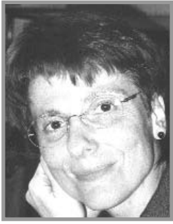
von Dr. Ingrid Fischer

Dem Beispiel Jesu beim Letzten Abendmahl folgend ( er nahm – dankte – brach – gab Brot und Wein ) bilden die Danksagung als zentrales Wortsymbol und das Brotbrechen als fundamentales Handlungssymbol auch in der heutigen Messfeier die beiden Grundvollzüge. Sie sind zuinnerst aufeinander bezogen und zielen auf die Kommunion: im geteilten Brot und Wein empfangen die Gläubigen Christus als den Leben spendenden sprichwörtlichen Bissen Brot und genießen zugleich im festlichen Schluck Wein den Vorgeschmack des kommenden Lebens in ihm in Fülle (vgl. Joh 10,10 ).